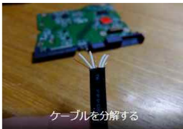
ケーブルを分解する