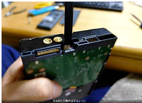
まあ何とか動作はするように

恐る恐るPCに接続。なんとか復活したものの、いつハンダが外れるか分からないので、激安6TBのHDDを買う。1.1万円なり。