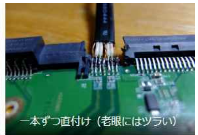
一本ずつ直付け (老眼にはツライ)