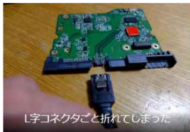
L字コネクタごと折れてしまった

ネットの情報を元に、HDDの基板の端子7カ所にSATAケーブルを直付けすることにした。ハンダ付け作業は老眼にはツラかった。