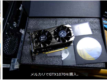
メルカリでGTX1070を購入。

で、当初、故障と決めつけてしまい発注した電源とともに換装することにした。まあ元の電源はバックアップに使える。