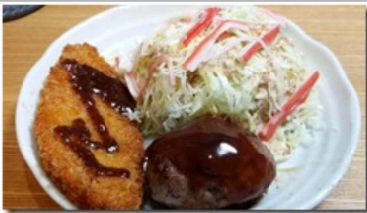
フライものとハンバーグ