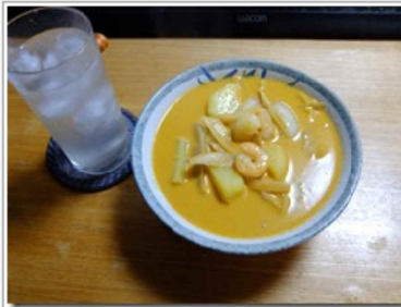
マッサマンカレー