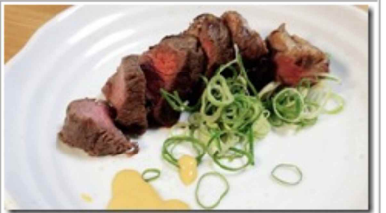
たまに贅沢にステーキ