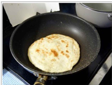
トルティーヤはフライパンで焼く