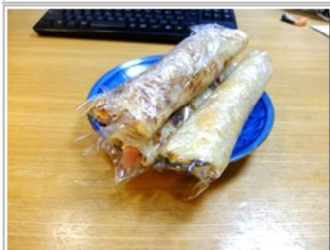
ラップで巻いて、一口大に切る