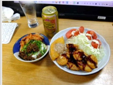
惣菜類盛り合わせ