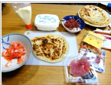
サラミを刻んでベーコンビッツ代わりに。あと生ハムやらトマトやら…