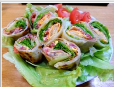
まあまあそれっぽい感じに