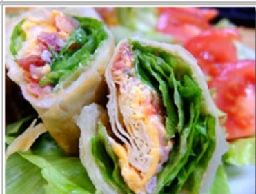
味もまあい感じで再現できた