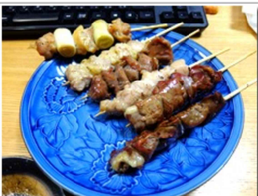
焼き鳥 コンベクショントースターでじっくり焼いた