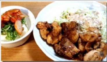
唐揚げやらステーキやら